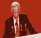
第八届北京香山论坛 THE 8 th BEIJING XIANGSHAN FORUM

主办单位：中华人民共和国外交部、中国国防国际交流中心、北京香山论坛秘书处 协办单位：北京外国语大学、北京第二外国语学院、北京语言大学、北京工商大学、北京物资学院、北京城市学院、北京联合大学、北京工商大学嘉靖学院、北京工商大学兴达学院、北京工商大学昆仑学院、北京工商大学昆仑学院、北京工商大学昆仑学院