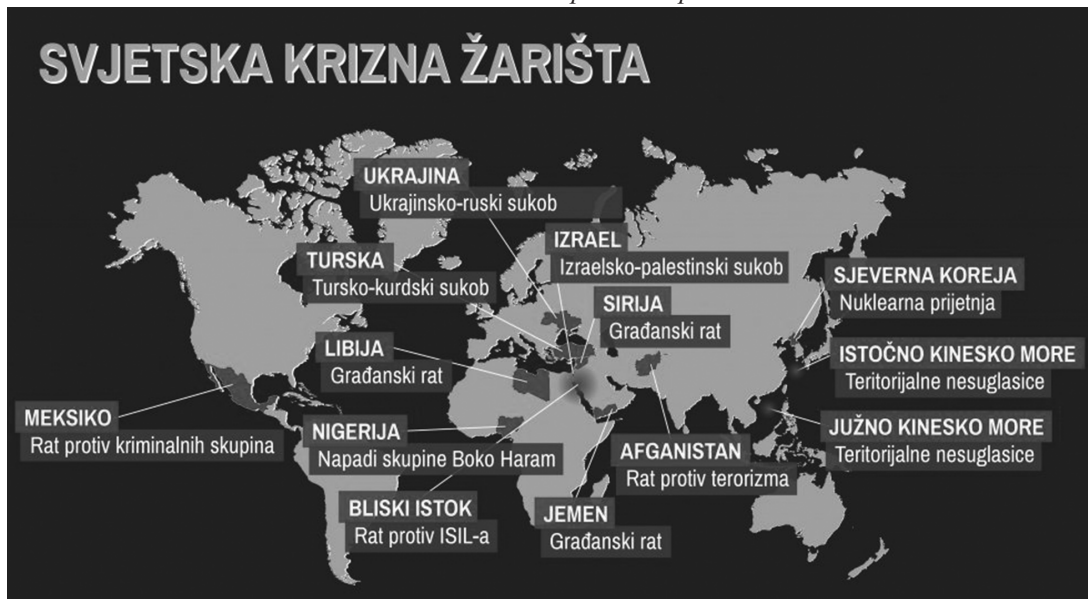
Слика 2. Светска кризна жаришта